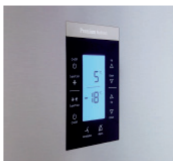
Pannello di controllo